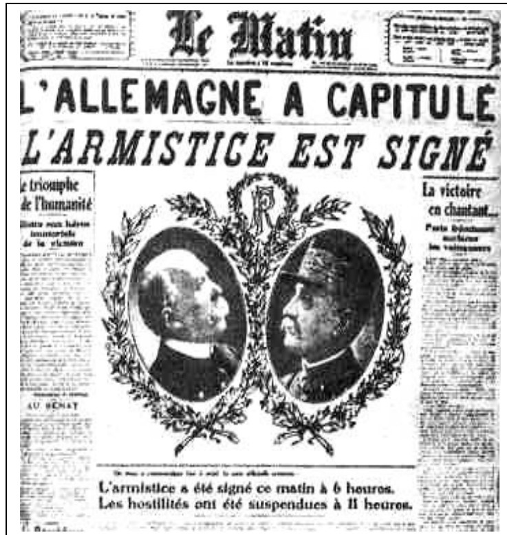
La Une du journal « Le Matin », le 12 novembre 1918.

Aujourd'hui, ils ne sont plus que 36 survivants, tous quasiment centenaires.